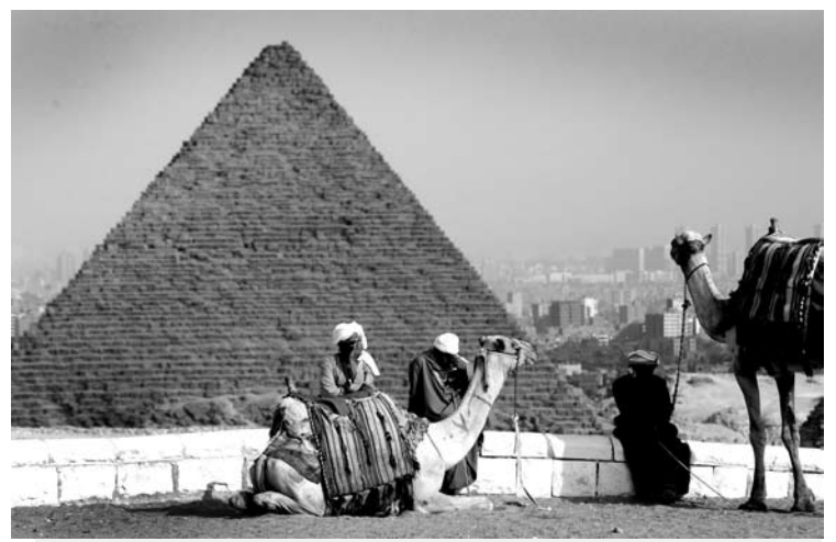
Grožėtis Egipto piramidėmis trukdo įkyrūs prekeiviai arabai.