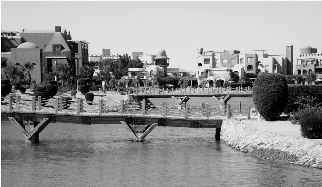
El Gounos kanalų krantus jungia daugybė tiltų.

Egiptas - šalis, į kurią keliauti geriausia, kai Lietuvoje žvarbu ir šalta, nes ten dabar vasariškai šilta, bet dar ne alinančiai karšta. Šalis tiems, kurių piniginės nėra tokios storos, kad galėtų siekti Tailandą, Australiją, Ameriką ar kitus egzotiškus Žemės kampelius. Į Egiptą kelionės netgi pigesnės nei į Turkiją, Graikiją ar Ispaniją, o egzotikos ir potyrių Egipte tiek, kad kartą nukeliavus norisi sugrįžti. Ypač į ramybės ir egzotikos oazę El Gouną, kurioje dabar 26 laipsniai šilumos..