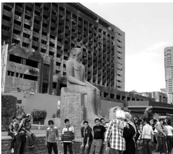
Kairo centre prie nacionalinio muziejaus budi kariškiai, o šalia muziejaus – valstybinis pastatas išdegusiais langais liudija nesenus neramumus.