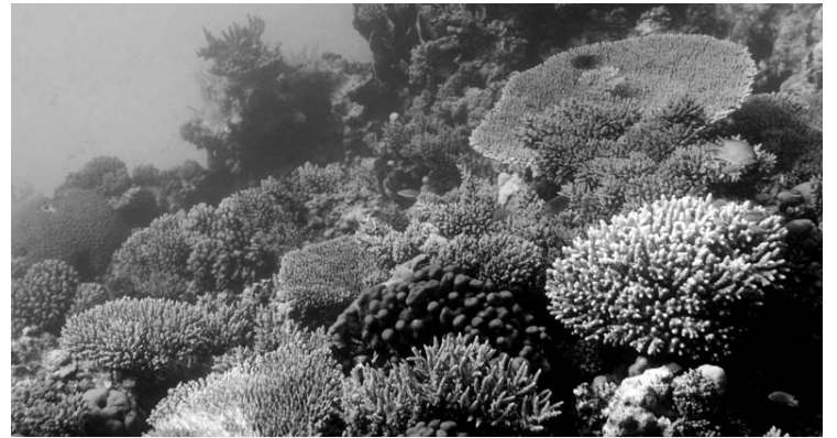
Koralai - Raudonosios jūros turtas, jais galima grožėtis, tačiau jokių būdu negalima liesti ar išsivežti.